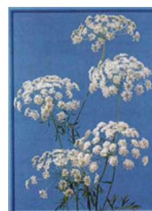
Ombrellifera Pianta A.M.M.I. dal greco ammos